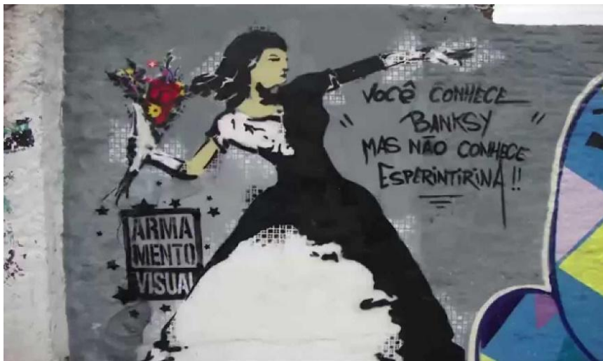
Figura 1. Grafite Espertirina.